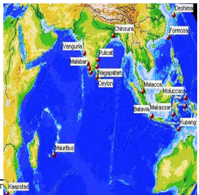
VOC kaart uit 1660