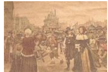
Oude schoolplaat: De Dam van Amsterdam in de Gouden Eeuw