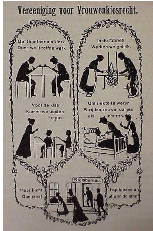
affiche voor vrouwenkiesrecht