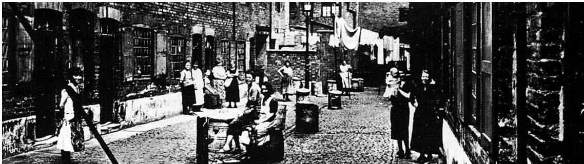
Straatbeeld 19de eeuw Amsterdam